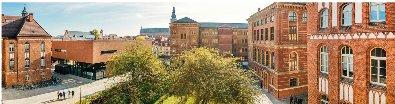
Rechts- und Staatswissenschaftliche Fakultät am Campus Ernst-Lohmeyer-Platz, Rechtswissenschaftlicher Fachbereich (Gebäudekomplex rechte Bildhälfte)

Hinsichtlich einer Übernachtungsmöglichkeit in Greifswald haben wir bei den folgenden Hotels und Pensionen in der Innenstadt günstige Vorreservierungen von Einzel- und Doppelzimmern unter dem Stichwort NORDKRIM 2023 avisiert.