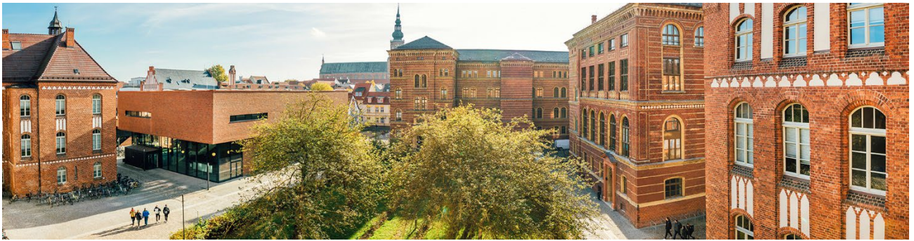
Rechts- und Staatswissenschaftliche Fakultät am Campus Ernst-Lohmeyer-Platz, Rechtswissenschaftlicher Fachbereich (Gebäudekomplex rechte Bildhälfte)

Traditionell bietet die Tagung die Gelegenheit, aktuelle kriminologische Forschungsergebnisse vorzustellen und zu diskutieren, wobei Beiträge von Nachwuchswissenschaftler*innen besonders willkommen sind. Als Präsentationsform für die Tagung sind Vorträge vorgesehen (je 30 Minuten plus 20 Minuten Diskussion).